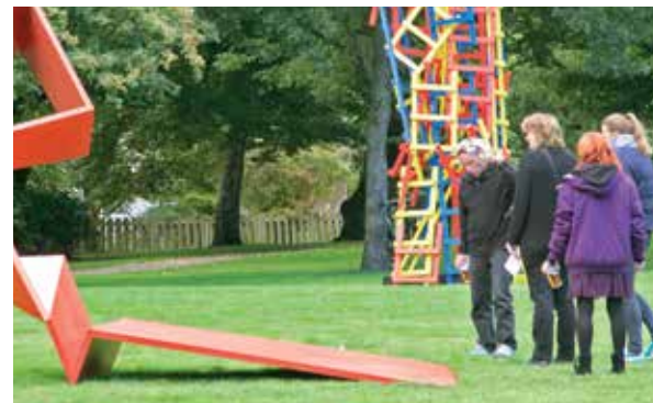
SKULPTURER I LOVPARKEN 2013

Vi arbejder på at nå et nyt jubilæum om 10 år.